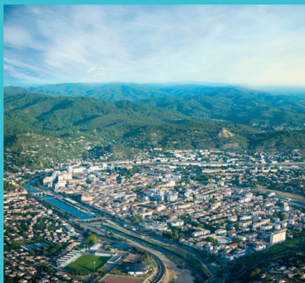
Alès est la ville-centre d'une agglomération de 72 communes et 133 546 habitants.