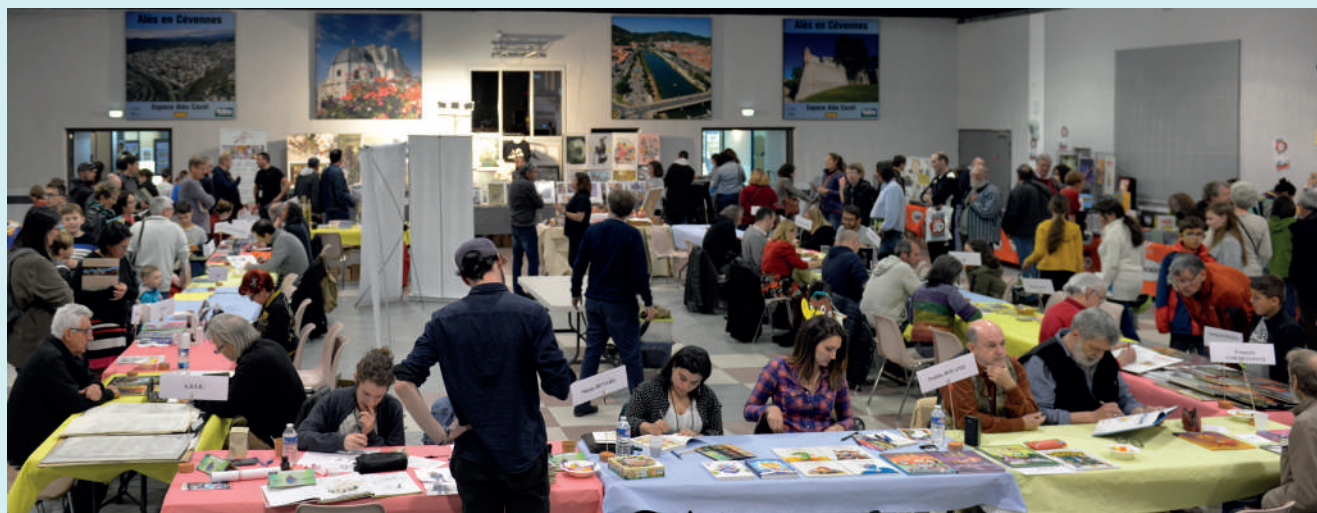
Séances de dédicaces à la salle Alès-Cazot, en 2019 lors de la 3 e Fête de la BD.