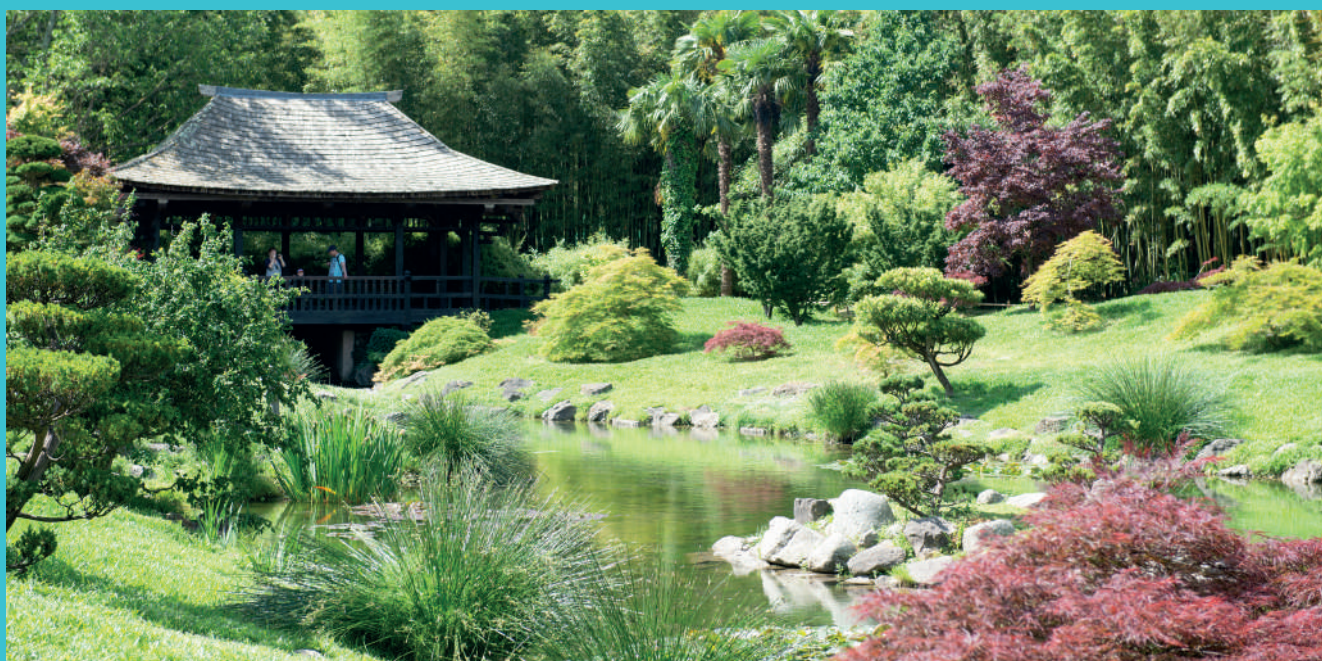
Le Vallon du Dragon, au cœur de La Bamboueraie, a été créé à l'occasion des 150 ans du parc par le créateur de jardin Erik Borja dans l'esprit des jardins japonais.